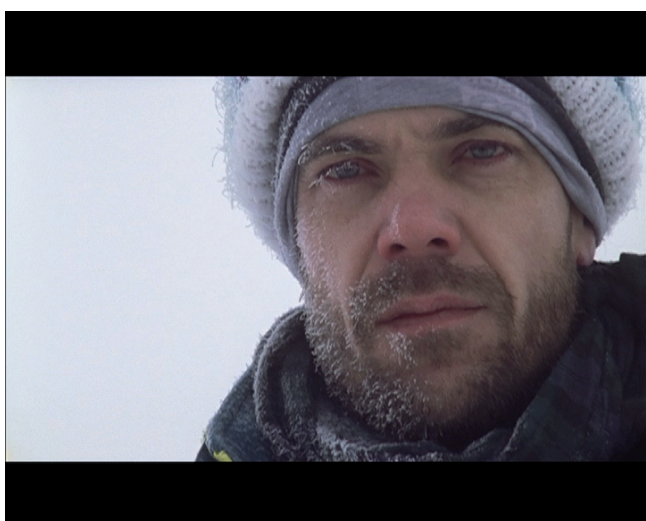
This is Alaska

Liv Strand är en av initiativtagarna till LARM, se under litteraturtips.