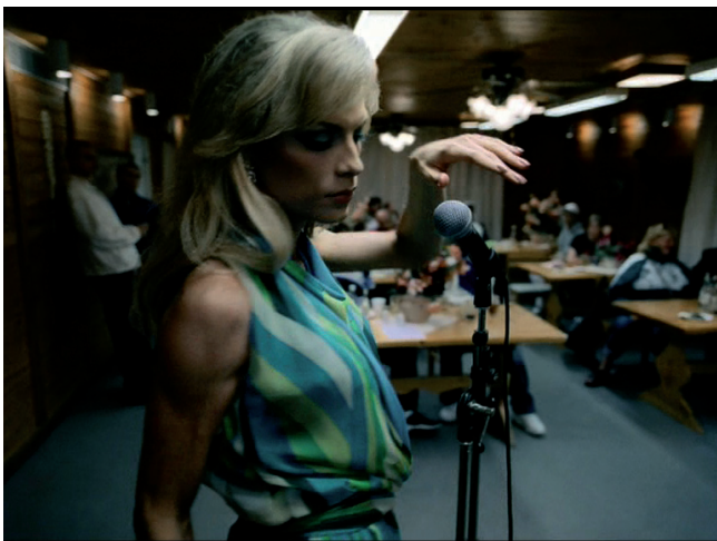
Pass This On